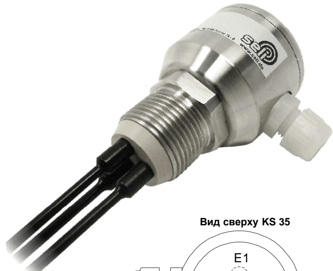
Вид сверху KS 35